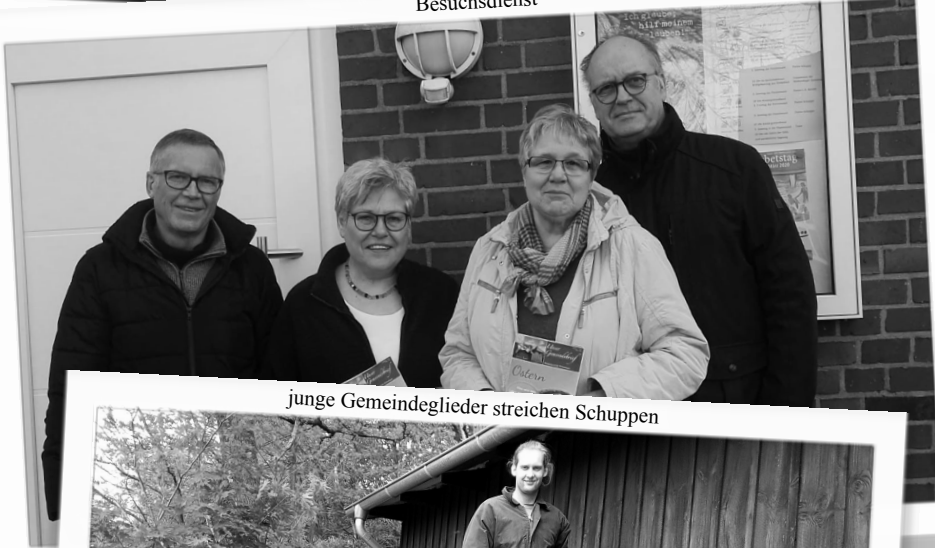
junge Gemeindeglieder streichen Schuppen